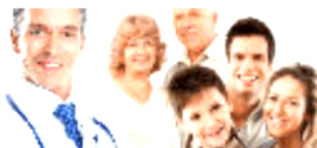
Il diabete passa anche dalle gengive