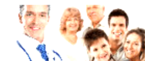
Diabete e parodontite, un nesso