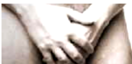
Parodontite come causa di impotenza