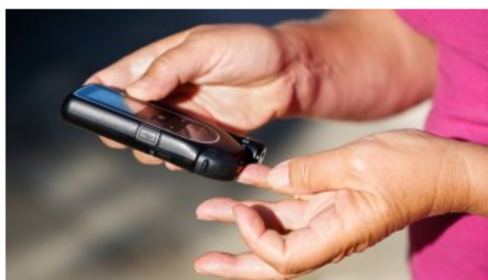
Il diabete è un'epidemia inarrestabile. In Italia si stimano 5 milioni di malati, ma un milione non sa neanche di esserlo

Il diabete è un'epidemia inarrestabile. Sono 415 milioni i malati di diabete nel mondo e 12 miliardi i costi indiretti del diabete in Italia (secondo una stima della London School of Economics).